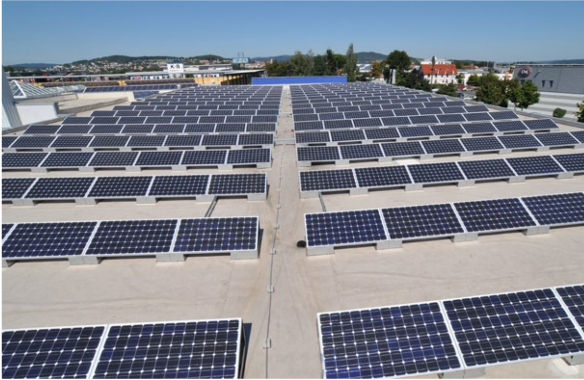
s:box® auf Foliendach