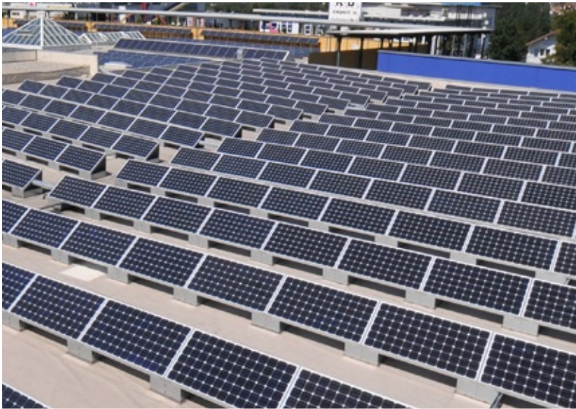
Flachdach und Freiflächen geeignet