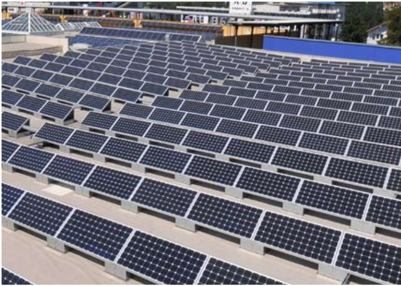
Flachdach und Freiflächen geeignet